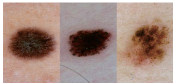
色素性皮肤病检测