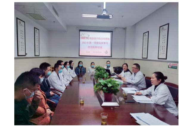
为保证中医住院医师规范化培训质量，贯彻落

实中医住培工作院级质控，找出住培工作的亮点和存在的不足，为下一步工作理清思路，指明方向，2021年3月-4月，铜陵市中医医院中医住培基地开展了2021年第一季度院级督导，严格从教学管理、培训质量等多方面找出不足、发现优点、提出建议，以促进住培工作更上一层楼。