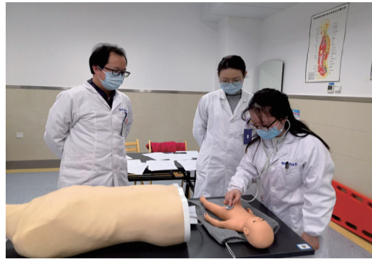
教学能力的培养，进一步探索更多的模拟培训课程。

我院住培教学中“情景模拟法”应用尚属起步阶段，下一步住培基地将进一步加大模拟师资